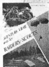
Aventure Vraie avec Menu 20€

Les incontournables disponibles auprès du Réseau Wingate