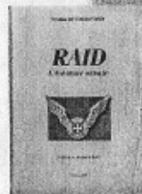
Raid - L'Aventure scoute - 16€