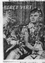
BERET VERT 7€