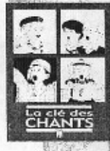
La clé des Chants 12€